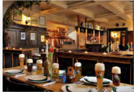
Antigua Cervecería Oberursel