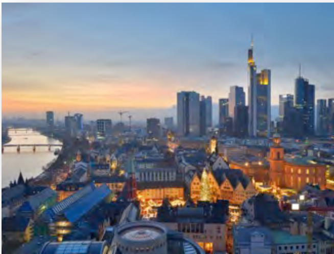
La nueva y antigua Frankfurt

Durante la semana del automóvil en Frankfurt visitaremos, aparte de ferias, fábricas y talleres de automóviles también una cervecería típica alemana, nos trasladaremos al río Rin, donde se cultiva la uva Riesling, haremos un paseo sobre el río Meno y para aquellos que lo deseen, podrán además gozar de una noche de ópera, un partido de fútbol de la Bundesliga o de una tarde de compras guiada.