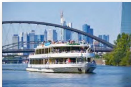
Barco sobre el río Meno